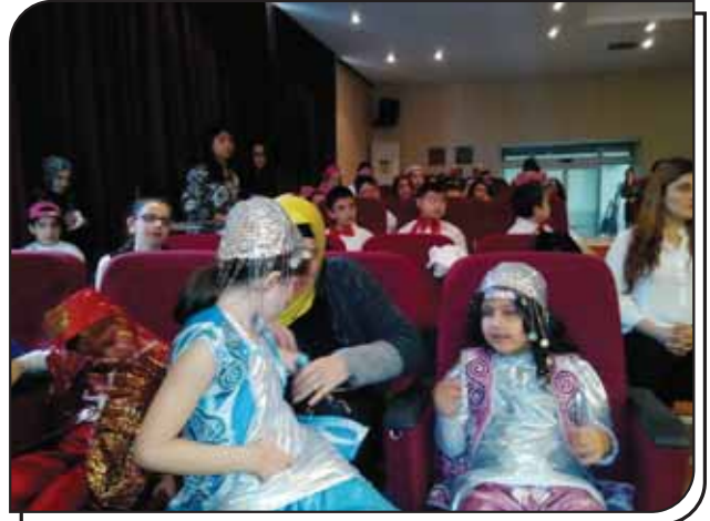
Öğrencilerimizin Heyecanla Gösterilerini Yapmayı Bekledikleri Bir Kare