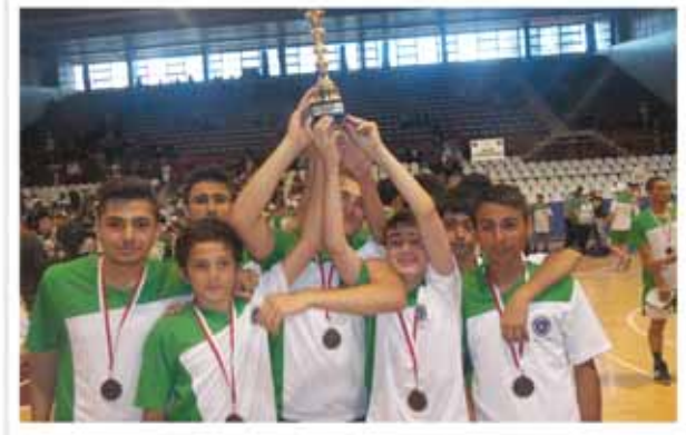
Futbol Takımı Kupa Töreni