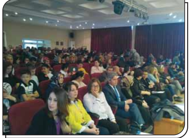
Toplantı Salonumuz Kutlama Programımıza Yoğun İlgi