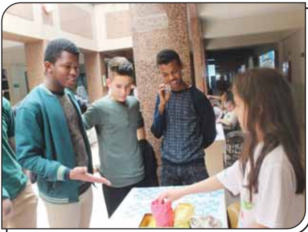
Uluslararası Öğrencilerin Fuarımızdaki Çalışmaları İncelemesi