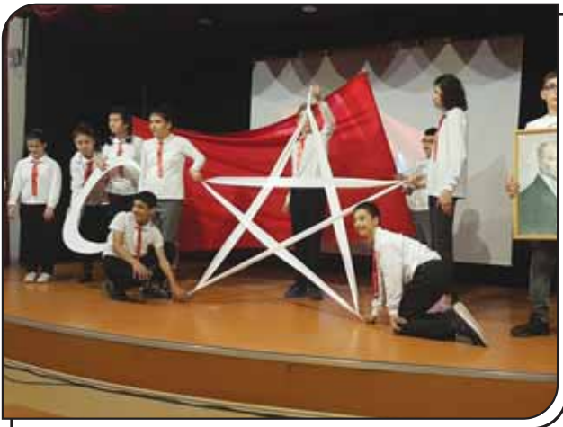
8A Sınıfının Gösterisi