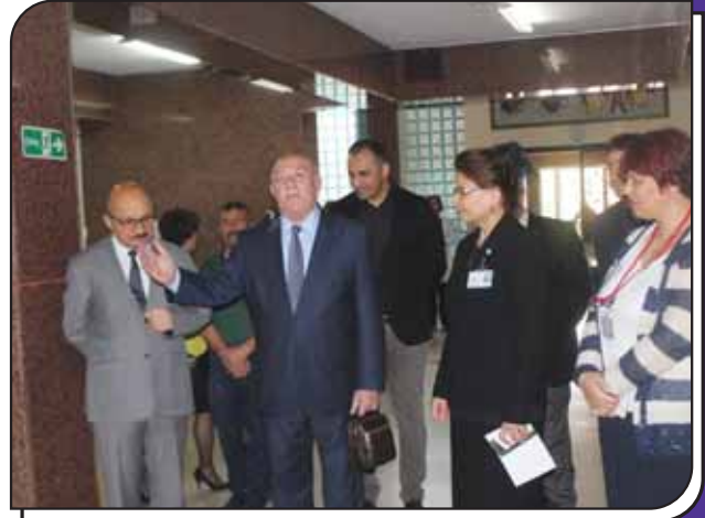
Bilim Fuarımızın Açılışı