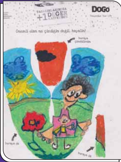
Öğrencilerimizin "Ablam Hamile" Adlı Resmi

Okulumuz öğrencisi Eyüp TUĞSAT kendi yaş grubundaki tasarımlar arasında 1. olma başarısını gösterdi. Ailesiyle beraber İzmir'deki ödül törenine katılarak kendi tasarımının yer aldığı ayakkabısını alan öğrencimizin mutluluğu bizleri çok sevindirdi. Başarılarının devamını diliyoruz.