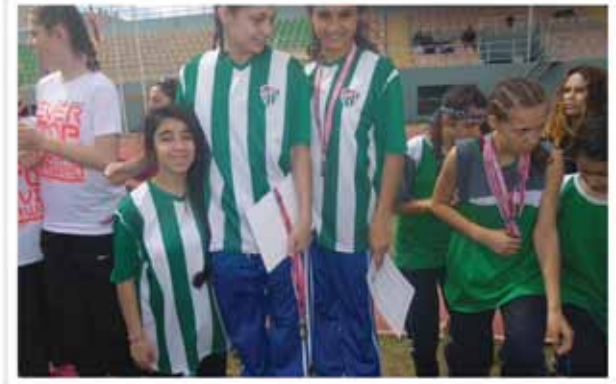
Atletizm Kız Takımımız Birincilik Kürsüsünde