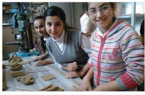
Seramik Çalışma Etkinliğimiz