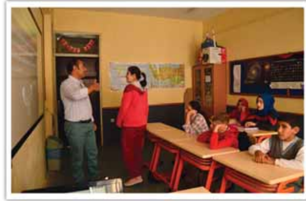
Din Bilgisi Sınıfı

Küçük yaştan işaret dili öğrenen çocuk ve aile okul çağına geldiğinde okuma - anlama becerisini artırır.