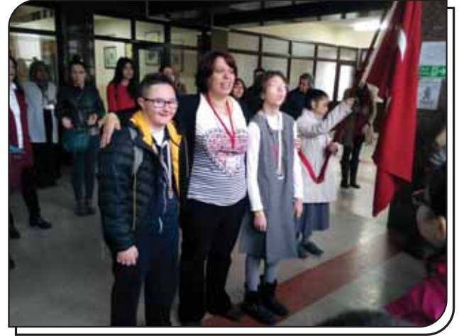
Yüzücülerimizin Madalya Sevinci