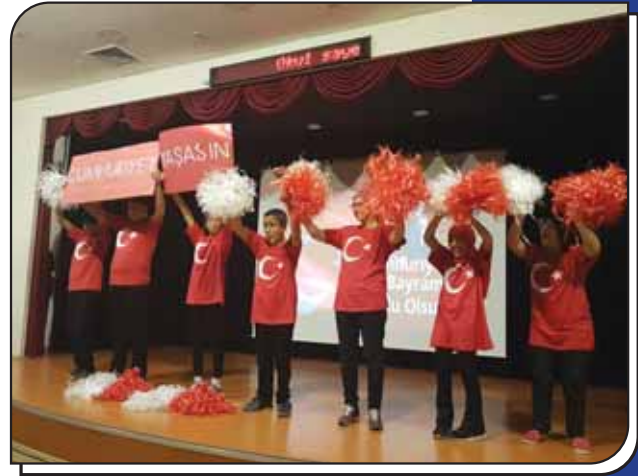
8C Sınıfının Gösterisi