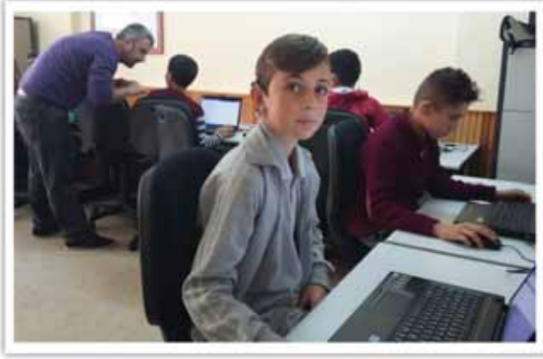
Bilim Teknolojileri Sınıfı

İşitme engelli çocukların okuma - yazma becerisi için okul kadar aile ve toplum işbirliği de son derece önemlidir.