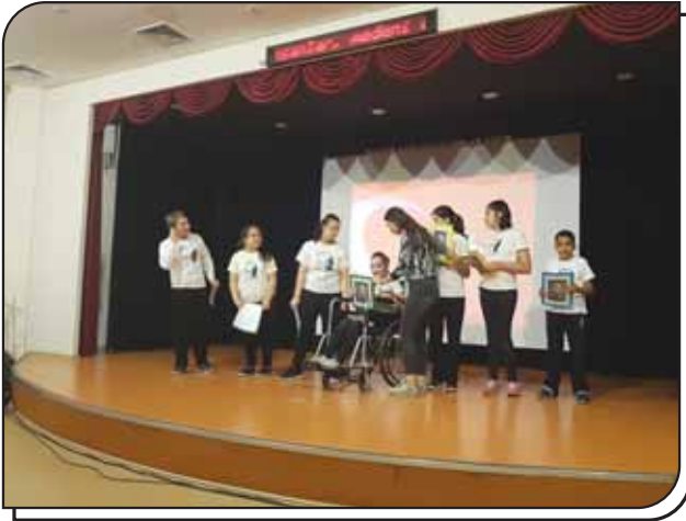
8B Sınıfının Gösterisi