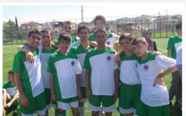
Spor Şenliklerinde Futbol Takımımız