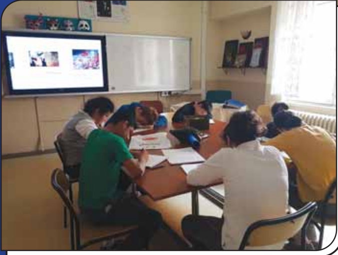
Görsel Sanatlar Sınıfımız