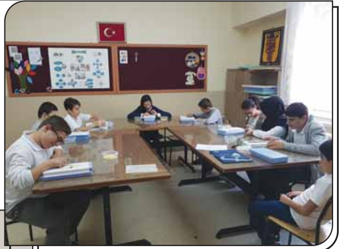
Teknoloji Tasarım Atölyesi