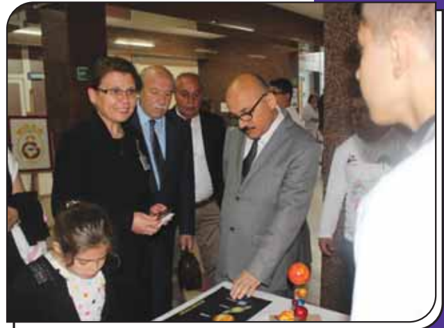
Protokolün Çalışmalarımızı İncelemesi