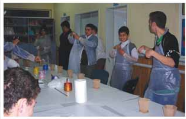
Ahşap Boyama ve Ebru Çalışmalarımız