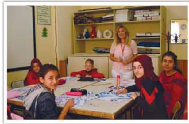
Teknoloji Tasarım Sınıfı

İşitme engelli öğrencilerin uygun ders materyalleri artırılmalı görsel öğeler desteklenmelidir.