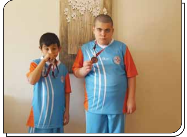
Öğrencimiz Madalya Sevinci