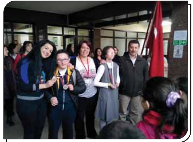
Madalya Sevincinin Okulda Paylaşılması