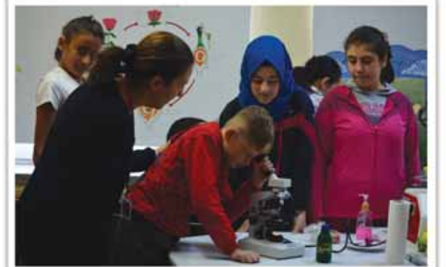
Fen ve Teknoloji Sınıfı