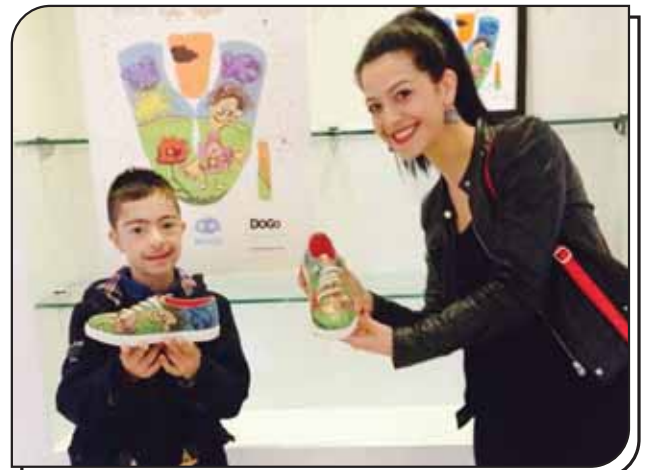
Ayakkabıya Basılan Resim