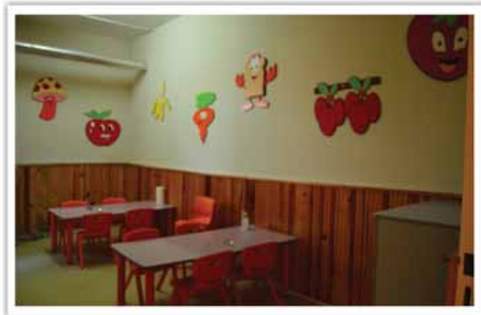
Ana Sınıfı Yemekhanesi