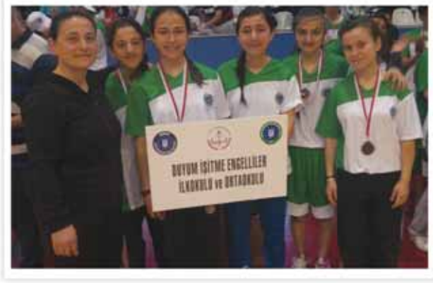
Yıldız Kız Takımı Madalya Töreni