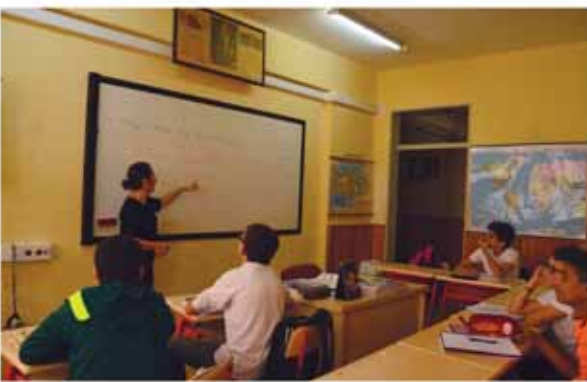
Sosyal Bilgiler Sınıfı