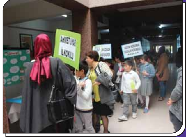
Bilim Fuarımızı Gezen Öğrenciler