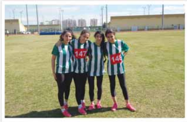
Yıldız Kız Türkiye Şampiyonu Bayrak Takımımız