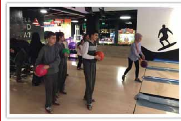
Doğum Günü Kutlamaları