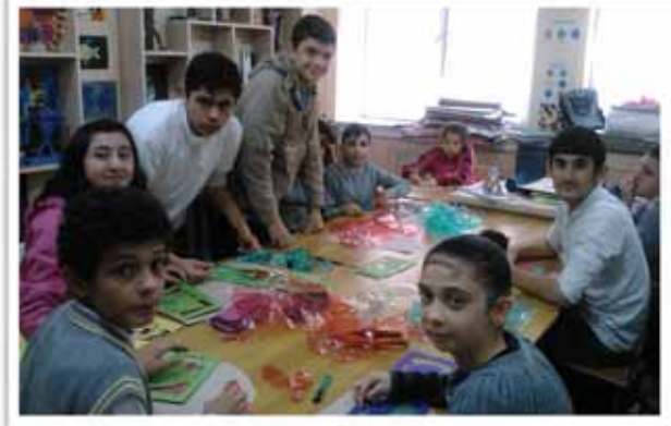
Görsel Sanatlar Sınıfı

İşitme engelli öğrencilerle konuşurken yüzünüz açık olsun, elinizi ağızınıza kapatmayın yüzünüzü çevirmeyin dudak okuyabilirsiniz.