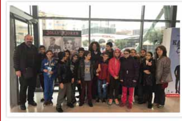
Okul Bahçesini Güzelleştirme Etkinliğimiz - Lale Ekimi