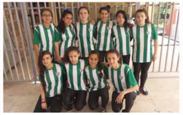
Yıldız Kız Atletizm Takımı Çalışmalar