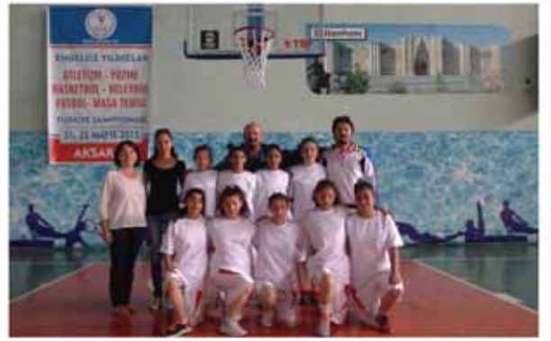
2014-2015 Yıldız Kız Basketbol Takımı Aksaray