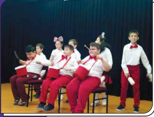
A4 Sınıfının 23 Nisan Ulusal Egemenlik ve Çocuk Bayramı Gösterisi

23 Nisan Ulusal Egemenlik ve Çocuk Bayramı her sene birçok etkinlik ile okulumuzda coşkuyla kutlanmaktadır.