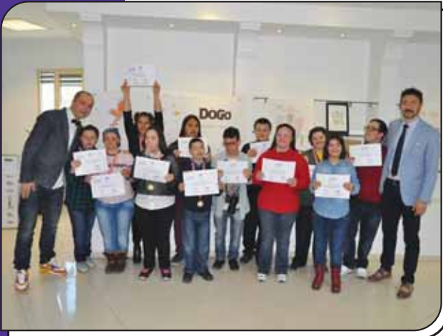
Ödüllerini Alan Özel Çocuklar