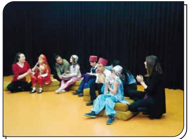
Görme Engelliler Sınıfı Öğrencilerinin Gösterisi