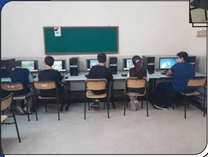
Bilişim Teknolojileri Sınıfı