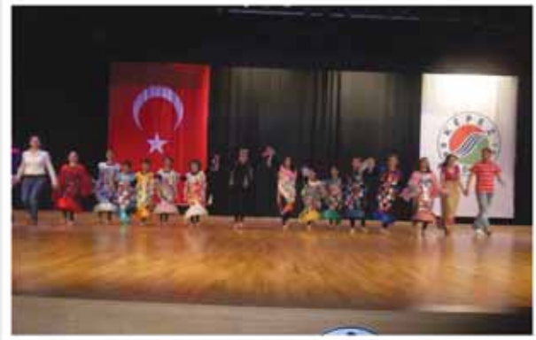
"Şımarık İspanyol Balığı" Tiyatro Oyunumuzdan